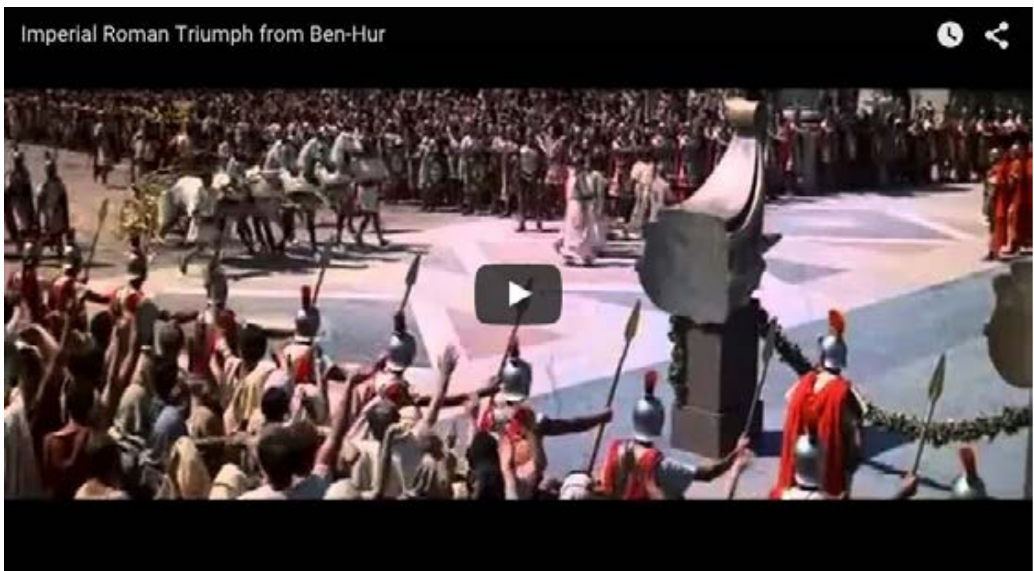
Escena de Ben-Hur – Triunfo Imperial Romano (Influencia de la música en la contextualización)

La elección del estilo musical puede estar en sintonía con el tipo de película a la que se aplica o alejarse de los criterios de género, pero en todo caso, es básico para crear el clima artístico de la película ya que la música contribuirá de manera muy importante a crear la apariencia externa general de la película.