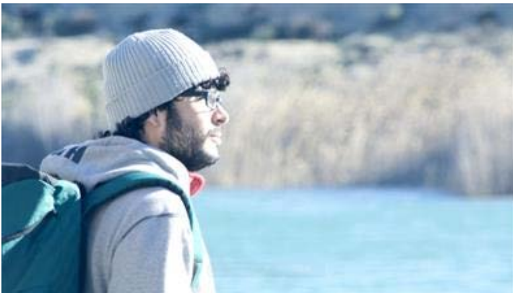
Fotograma “La boda”. Cortometraje presentado al FICIE